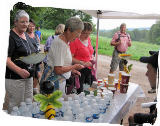
Tournoi de Pétanque