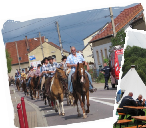
Fête des Cavaliers